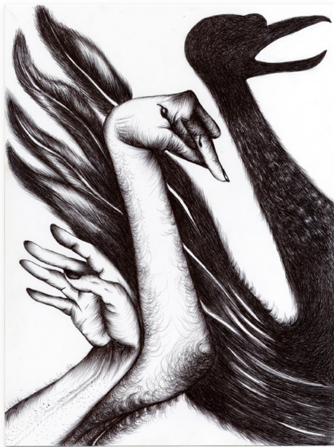
לדה והברבור. עט כדורי על נייר, 23x30 ס"מ, 2022