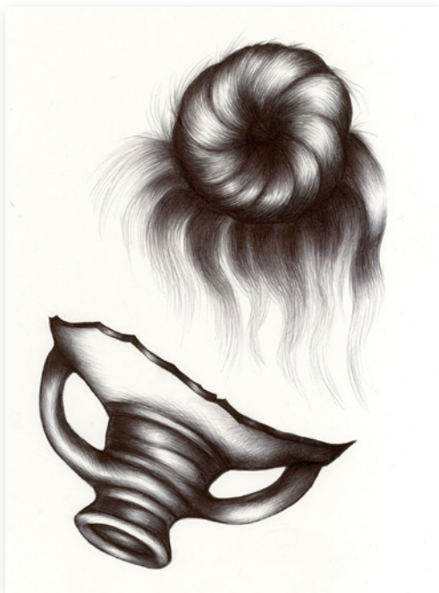
צלמית. עט כדורי על נייר, 23x30 ס"מ 2022