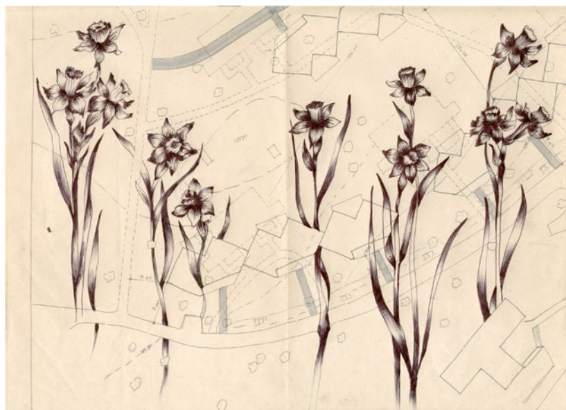
נרקיסים. עט כדורי על נייר, 40x30 ס"מ, 2022